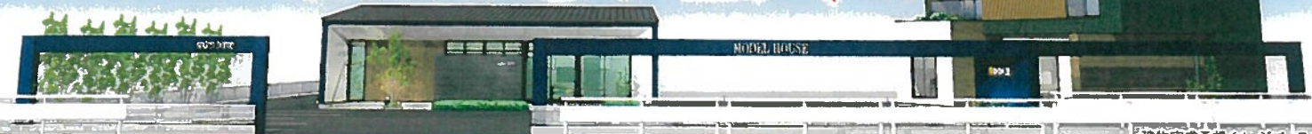
建物完成予想イメージ