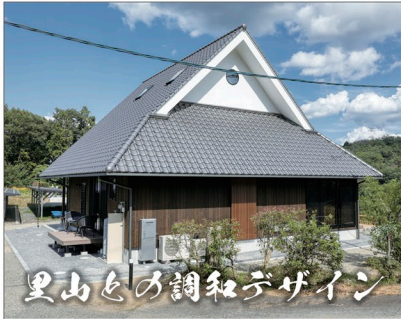
里山との調和デザイン