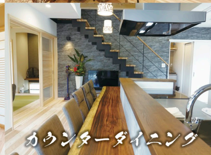
カウンターダイニング