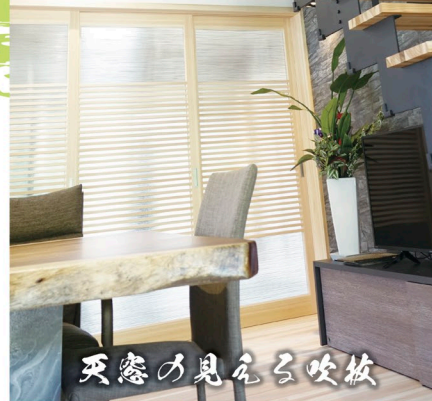
天窓の見えろ吹板