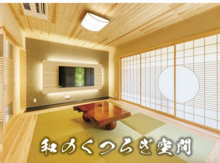
和のくつろぎ空間